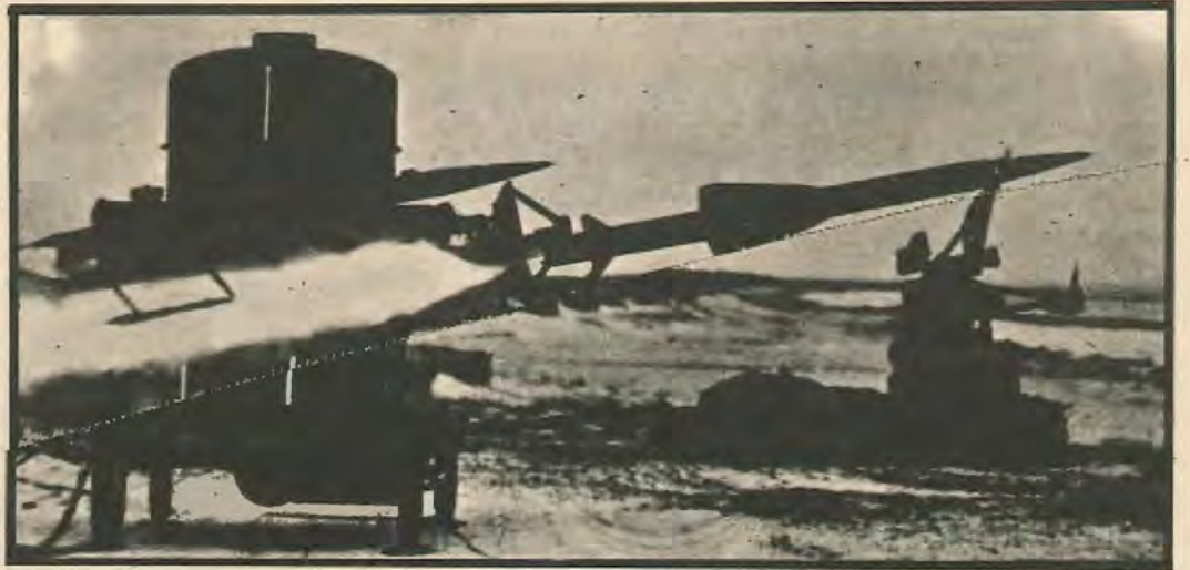
ΟΙ ΝΕΟΙ ΤΥΠΟΙ άντιαεροπορικών πυραύλων "Rapier", Άγγλικής κατασκευής, με τους οποίους οι Βρετανοί ενισχύουν αυτό τον καιρό με άκρα μυστικότητα την αντιαεροπορική άμυνα της βάσεως Ακρωτηρίου. Τους μετέφερε στην Κύπρο τό Βρετανικό ελικοπτεροφόρο «Ερμής». Έχουν μήκος 2.2 μέτρων και μπορούν να πλήττουν στόχους μέχρι ύψους 3.000 μέτρων.

Να φύγουν οι βάσεις από την Κύπρο είναι το άμεσο αίτημα του λαού.